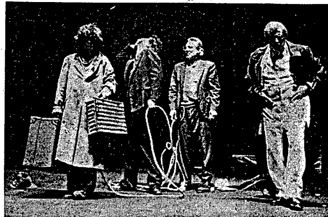
Enzo Jannacci e Giorgio Gaber da soli e in una scena corale di questo «Aspettando Godot», al Goldoni di Venezia fino a domenica 3 giugno.

Un Andreasi smemorato e i fischi dei microfoni hanno «attentato» al Beckett messo in scena dai due showmen, da elogiare però per il loro allestimento quasi-comico e ricco di estro